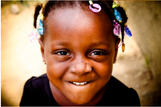
A = RIRE